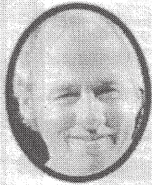
SHOW ... Knopfler

Knopfler, the ex-Dire Straits front man, agreed to play on the single and